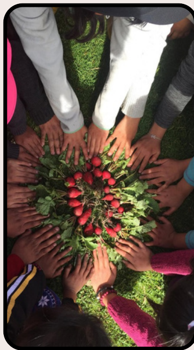
Ayuda social a población vulnerable