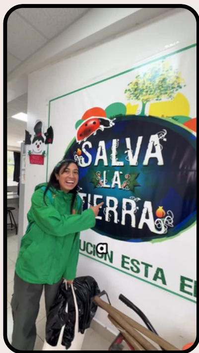
Educación ambiental en colegios