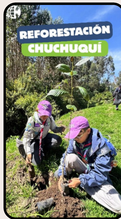
Campañas de reforestación