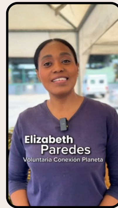
Rescate de alimentos

Más allá de la gestión de residuos, impulsamos iniciativas ambientales y sociales que generan impacto positivo en comunidades, espacios educativos y sectores vulnerables de la ciudad.